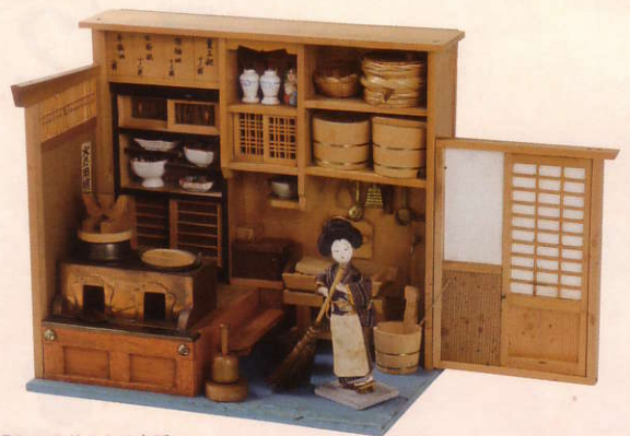
勝手道具～調理場とかまどのある台所～ (日本/大正末期/木製)