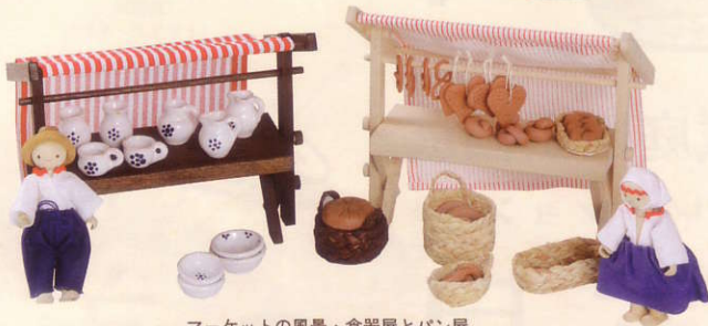
マーケットの風景・食器屋とパン屋 (スロバキア/木・布・陶器製)

野原の真ん中にごさを敷き、草のお皿に土団子や花びらを盛って遊んだ幸せな光景。大人の真似をして遊ぶままごととは、「まま(飯)」の「ごと(行事)」を指し、古今東西の子どもたちに愛されています。ままごとは、調理や食事などから発して、生活全般を真似た様々な遊びへと広がっていきます。日本においては『源氏物語』にも「ひみな(雛)あそび」として描かれ、1000年以上も子どもたちに愛されてきたことがうかがえます。