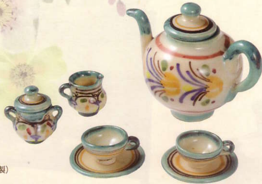
ティーセット (スペイン/陶器製)