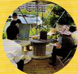
③プランターでソラマメを育てよう