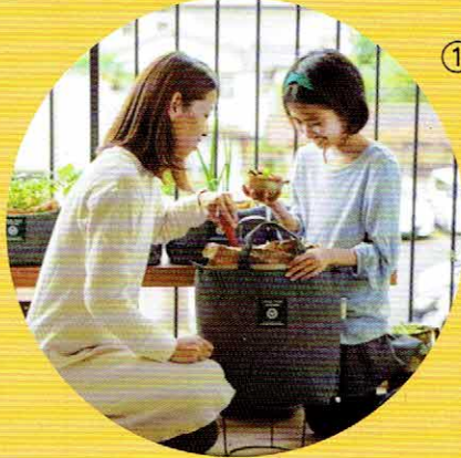
①バッグ式(LFC)コンポストの使い方講座